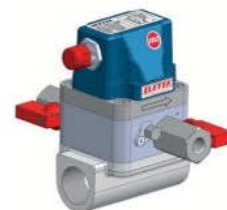
M-G15 avec Multiblock