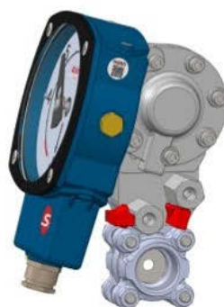
S-GSS25 avec Multiblock